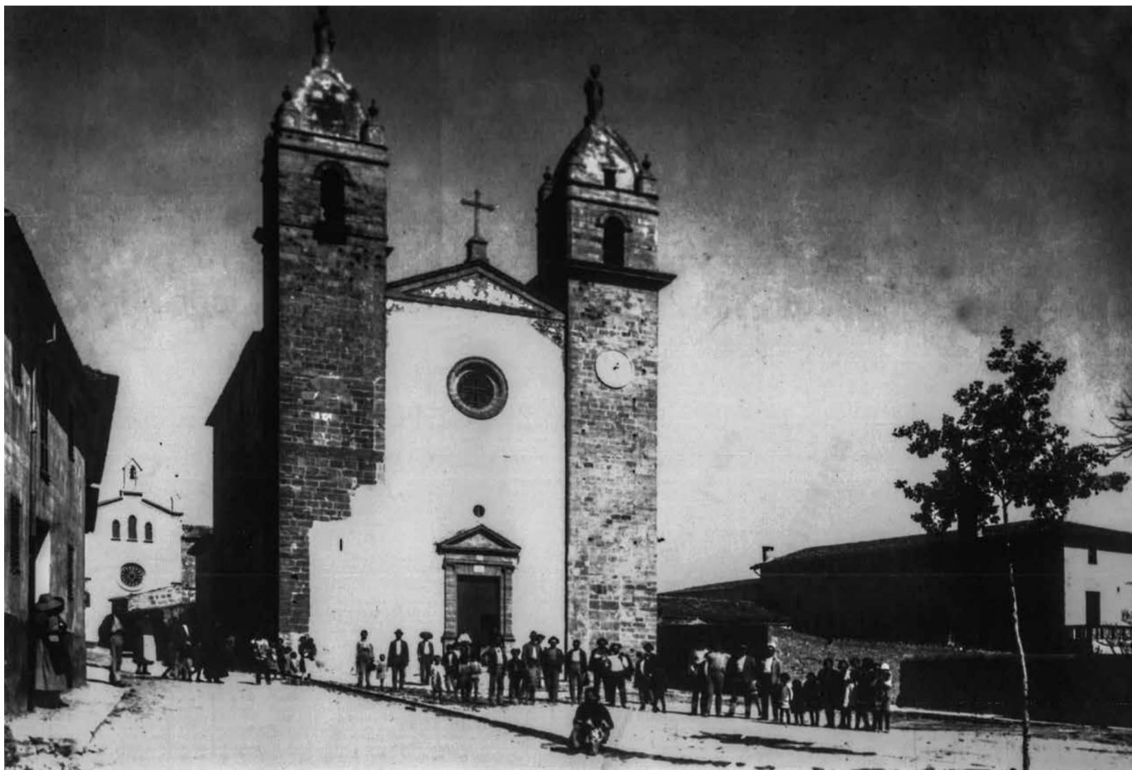
Fotografia de la plaça i església de Sant Cosme i Sant Damià de Pina de devers l'any 1905. Observau, al fons a l'esquerra, el nou Convent de les Germanes Franciscanes Filles de la Misericòrdia i, a la dreta, la casa pairal de la família dels Ribes.

C/ del Rei, 6. 07210, Algaida. Tel.: 971 12 50 76 · 971 12 53 35. C/e.: ajuntament@ajalgaida.net . Web: www.ajalgaida.net