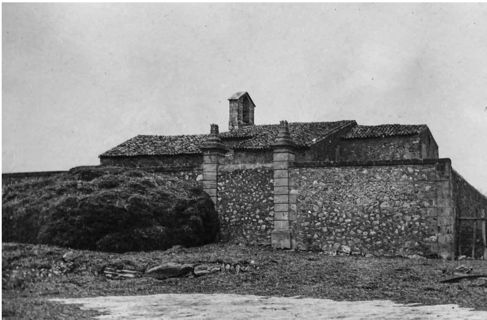
Fotografia de 1930 de l'església de Castellitx (s. XIII).

C/ del Rei, 6. 07210, Algaida. Tel.: 971 12 50 76 · 971 12 53 35. C/e.: ajuntament@ajalgaida.net . Web: www.ajalgaida.net