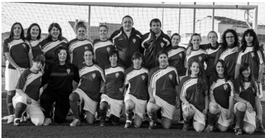
EQUIP FEMENÍ DEL CE ALGAIDA QUE LA TEMPORADA 2011-2012 fou campió de Lliga, de la Copa Federació i aconseguiren el darrer ascens a la Lliga Autònoma. Un dels nombrosos exemples de «projecte de Club socialment inclúsiu i esportivament guanyador.»

mesura darrera aquelles millores encara hi havia els socis fundadors, però hi entrà de ple l'Ajuntament d'Algaida, consolidat institucionalment i amb suport de la Comunitat Autònoma, creada el 1983. Els terrenys del camp de futbol i de l'entorn van ser adquirits per l'Ajuntament, entre d'altres coses perquè aquest era un dels grans objectius dels socis fundadors i de tot l'entorn del Club.