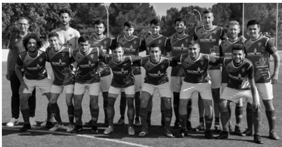
A dalt: EQUIP DEL CE ALGAIDA QUE DIUMENGE DIA 25 DE JULIOL DE 1971, diada de Sant Jaume, inaugura el camp es Porrassar. A baix: imatge de part de l'EQUIP QUE DIUMENGE DIA 25 DE JULIOL DE 2021 JUGARÀ EL PARTIT DEL CINQUANTANARI. Cinquanta anys exactes separaran les dues fotografies.

o col·laborant-hi. Durant les dècades dels vuitanta i dels noranta del segle XX, la història esportiva i social del Club és força desigual. Durant els anys vuitanta es feren les primeres