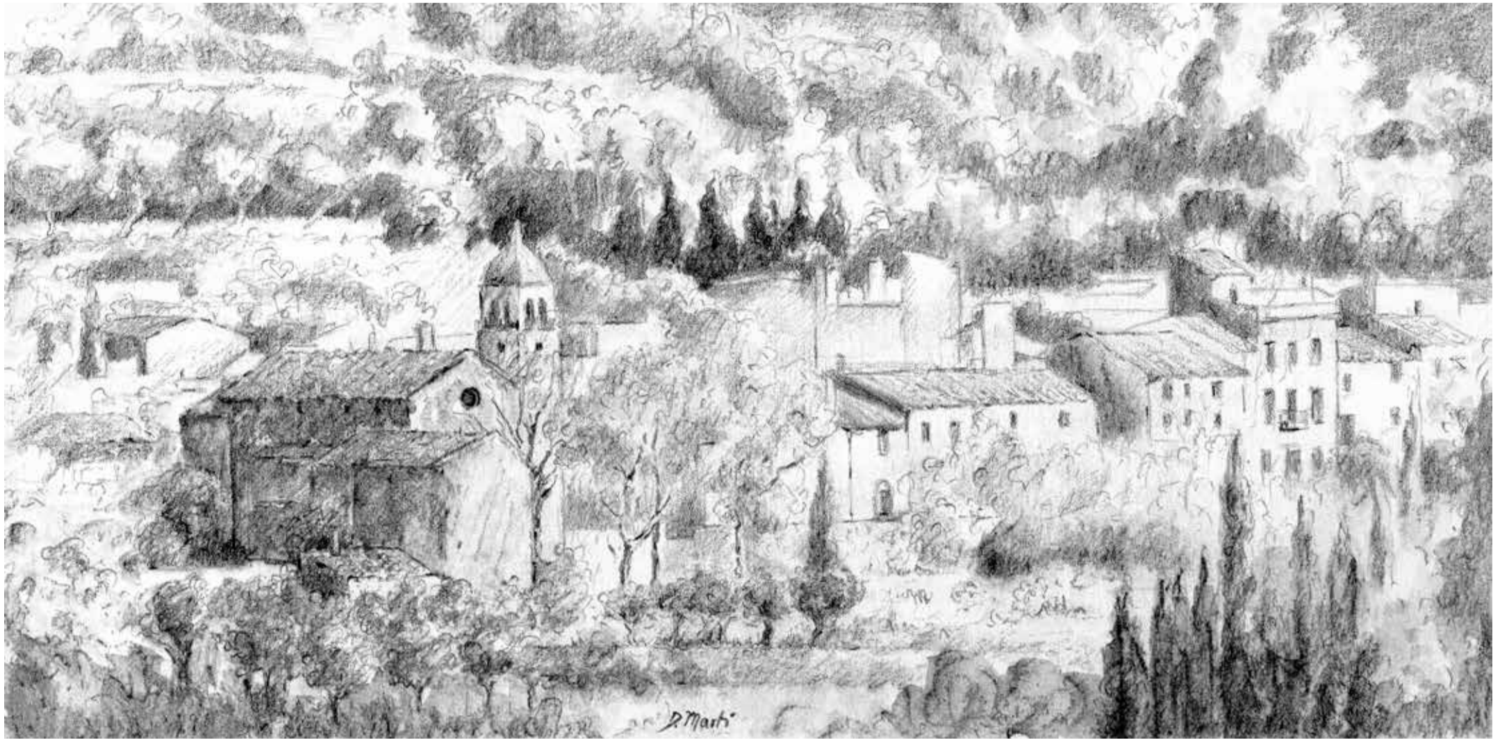
DONES ARTISTES D'ALGAIDA, PINA I RANDA. Randa. Dolors Martí. Llapis i aquarel·la damunt paper.

AJUNTAMENT D'ALGAIDA. C/ del Rei, 6. 07210, Algaïda. Tel.: 971 12 50 76 · 971 12 53 35. C/e.: ajuntament@ajalgaida.net . Web: www.ajalgaida.net