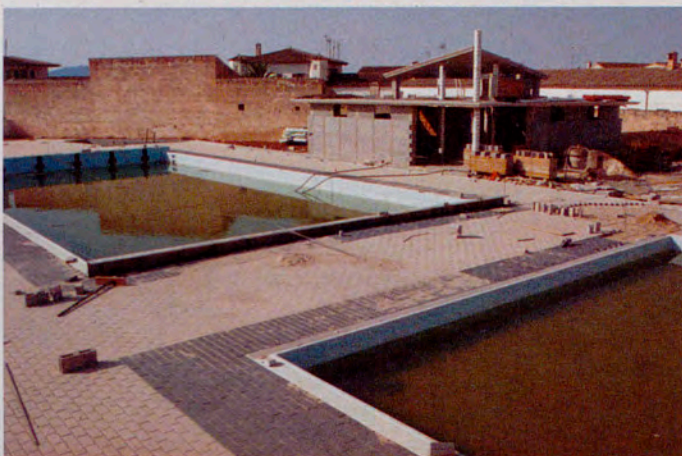
Juny 2001. Es comencen les obres dels vestidors i es posen les rajoles de la terrassa que l'envolta.