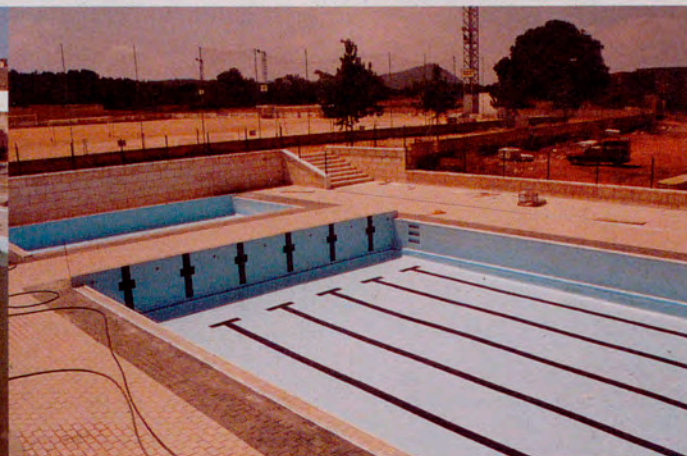
Juliol 2001. Coincidint amb les festes de Sant Jaume, s'inauguren les instal·lacions. L'agost s'obren al públic.