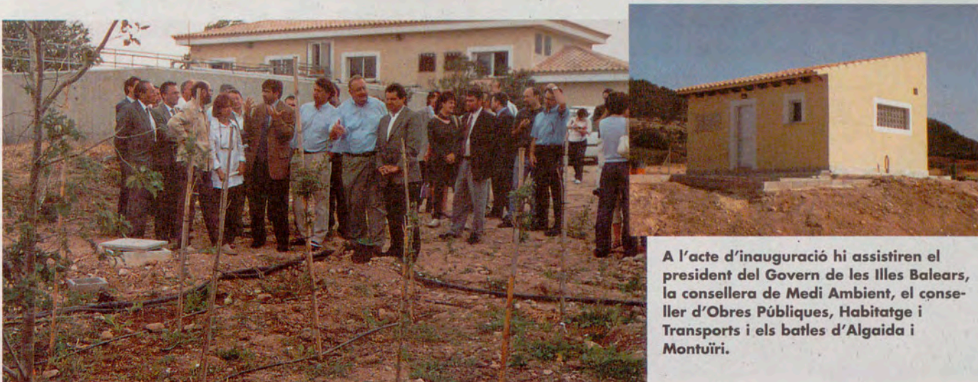
A l'acte d'inauguració hi assistiren el president del Govern de les Illes Balears, la consellera de Medi Ambient, el conseller d'Obres Públiques, Habitatge i Transports i els batles d'Algaida i Montuïri.

► La nova Estació Depuradora d'Aigües Residuals (EDAR) d'Algaida i Montuïri, inclosa en el projecte Dendro Depuració signat entre la UIB i l'Ibasan, ja permet gaudir d'un sistema de depuració terciària d'aigües.