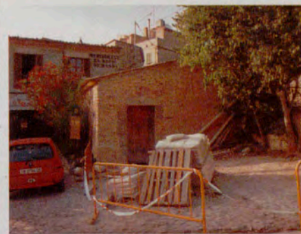
Estat actual de la futura Unitat Sanitària de Randa

Continuen executant-se les obres del consultori mèdic de Randa, que es preveu estiguin acabades a final de l'estiu. El projecte s'ha retardat respecte al termini inicial degut als problemes orogràfics que s'han trobat. La presència d'un aqüífer al terreny on està la futura unitat sanitària del nucli ha obligat a fer obres de drenatge per tal d'evitar les filtracions d'aigua que es poden produir a l'immoble. A més, s'ha hagut de fer una sèquia per reconduir l'aigua que hi ha als terrenys. Tot i així, els nous equipaments es segueixen duent a terme.