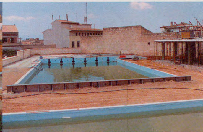
Maig 2001. El bon ritme de les obres ja deixen veure l'aspecte pràcticament definitiu de la piscina.