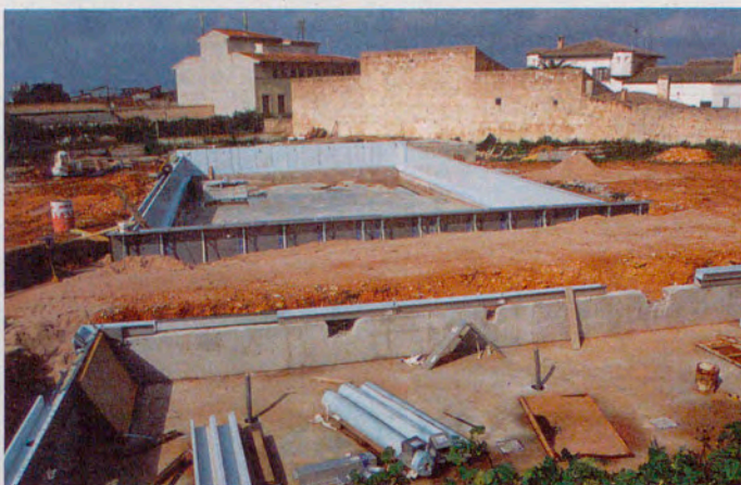
Abril 2001. Vista dels fonaments de la piscina i del moviment de terres duit a terme per a la seva instal·lació.

La zona dels vestidors no estarà acondicionada fins a final d'estiu, a falta dels darrers detalls, però això no impedirà el seu funcionament. De manera provisional, s'habilitaran per aquest estiu els vestidors del camp de futbol.