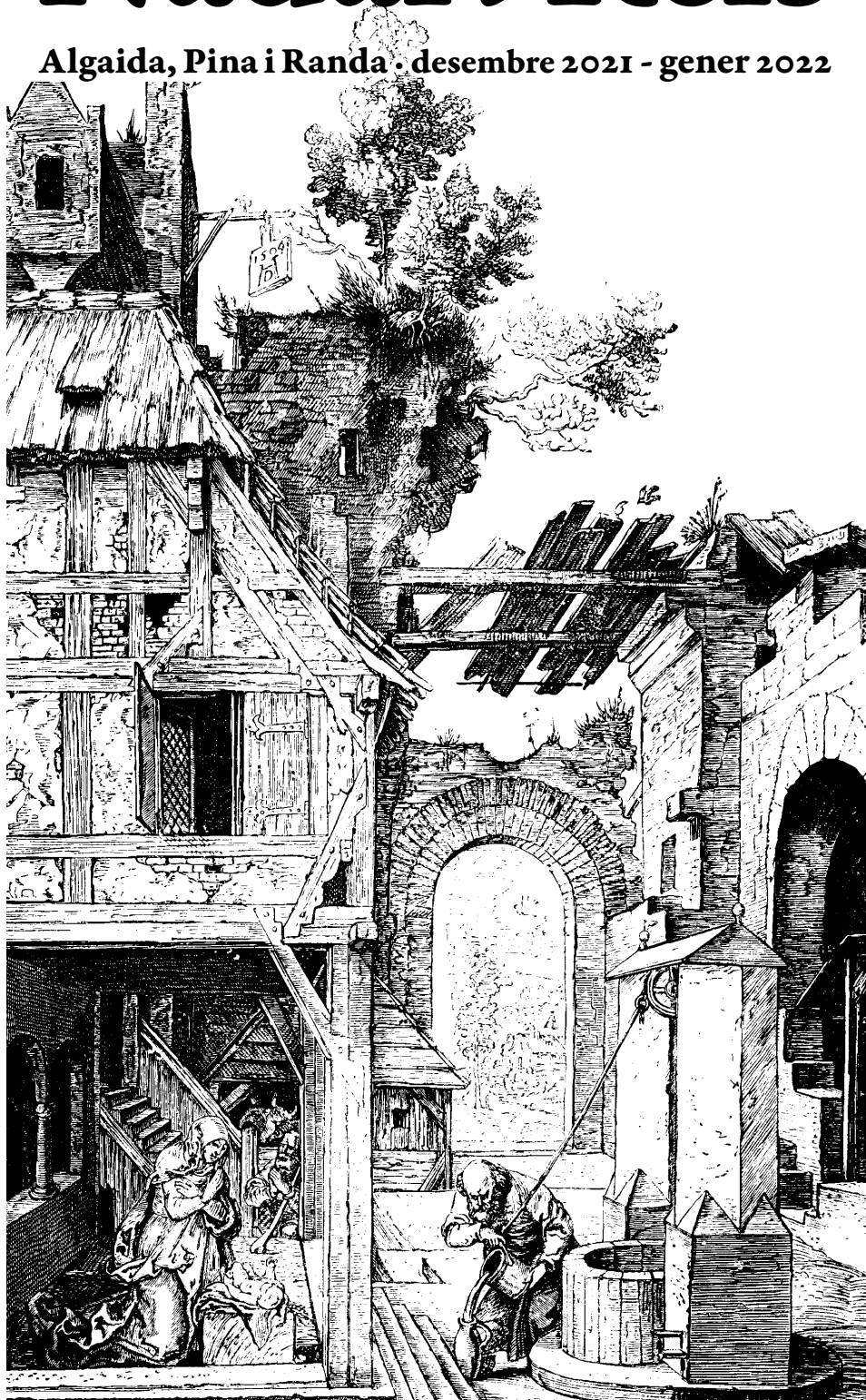
La Nativitat (1504) gravat d'Albrecht Dürer (Nuremberg, 1471-1528)

Algaida, Pina i Randa · desembre 2021 - gener 2022