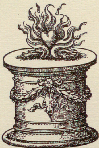
Foc. Emblema atribuït a Hans Sebald Beham. Frankfurt, 1546.

A mb motiu de la Festa de la Pau de Castellitx, la Comissió Organitzadora, amb el patrocini de l'Ajuntament d'Algaida, convoca el XXV Certamen de Poesia i Narració Curta, el XXIII Concurs de Poesia Popular (Glosat) i el VI Premi d'Investigació Castellitx, segons aquest plec de condicions.