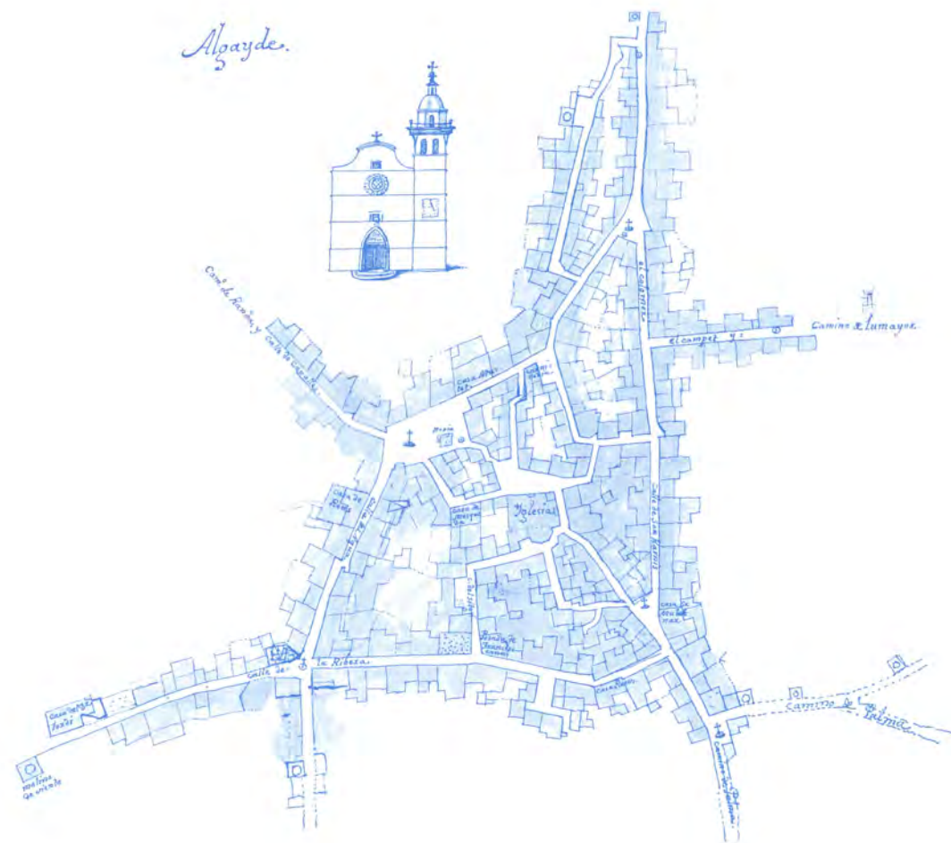
Mapa i detalls del plànol de la vila d'Algaida confeccionat per Jeroni Berard. L'any 1986 la revista Es Saig obsequià els lectors amb una reproducció facsímil en color.

Els capítols del carnisser no només establien les obligacions, sinó també un conjunt de sancions per quan hi hagués incompliments. Aquests capítols foren renovats el 1803. Sembla, però, que les condicions imposades no feien atractiva aquesta feina, perquè al 1826 a les actes de l'Ajuntament s'informa que no hi havia carnisser a Algaida. Tanmateix, sí que tenim constància de l'existència de la carnisseria a Al-