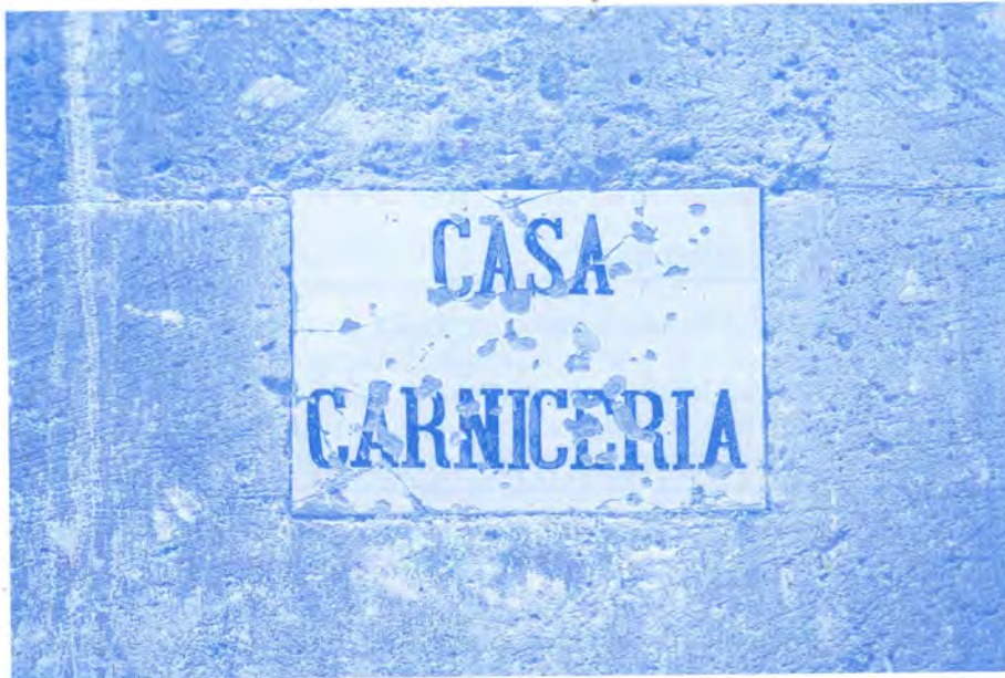
Detall de la rajola situada dalt del portal del carrer de la Beata de l'antiga peixateria, prova que, antigament, l'edifici serví com a lloc de venda de carn.

Aquest any 2020, que ha esdevingut tan especial per les circumstàncies de la pandèmia del COVID-19, a proposta del Consell de Cultura del Municipi d'Algaida va ser designat com Any del Patrimoni, amb l'objectiu de promoure i difondre els elements patrimonials, en el sentit més ampli, dels pobles d'Algaida, Pina i Randa. Forma part d'aquest objectiu la rehabilitació de l'antiga peixateria en un espai per a dur-hi a terme mostres artístiques.