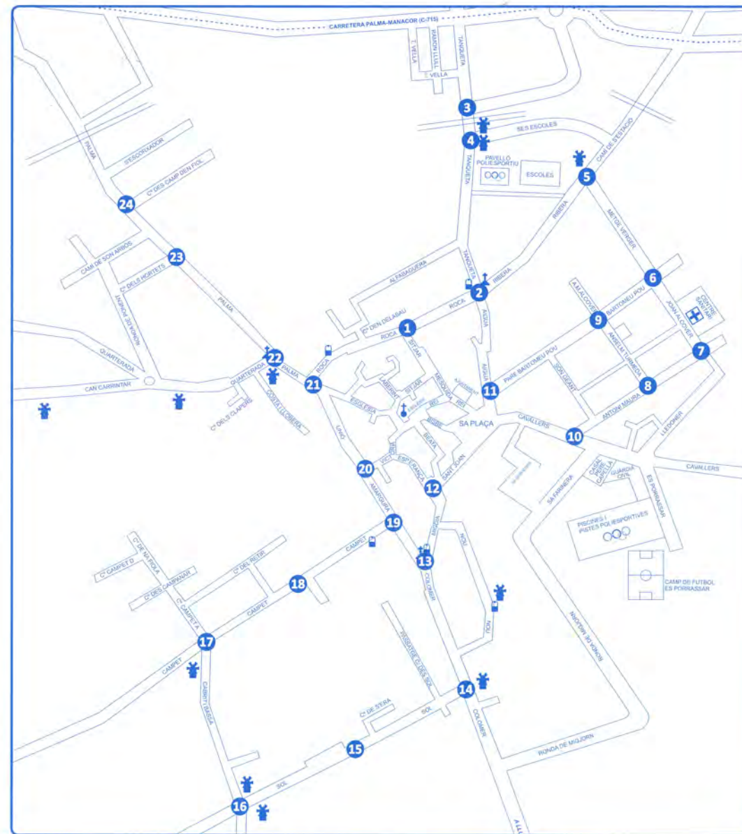
Recorregut del Quadrat especial i llocs on dansaran els Cossiers.