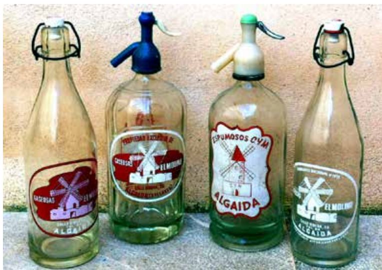
Imatge amb antigues botelles de refrescs i sifons d'Espumosos CYM i de Gaseosas el Molino. Col·lecció particular.

tocaven les botigues: començant per Can Coent del cantó de la Ribera, ca na Putxa, forn del Sitjar, ca na Barrera, carnisseria de ca na Beneta, Cas Colaús, ca na Bauçana, Can Pep Sabater, Can Rapinya, Ca na Molla, can Coent des Colomer, Can Roca de la Placeta, forn de can Dides del carrer de Sant Joan, Can Palou i la carnisseria de ca na Petra i, de pas, tots els particulars que eren clients.