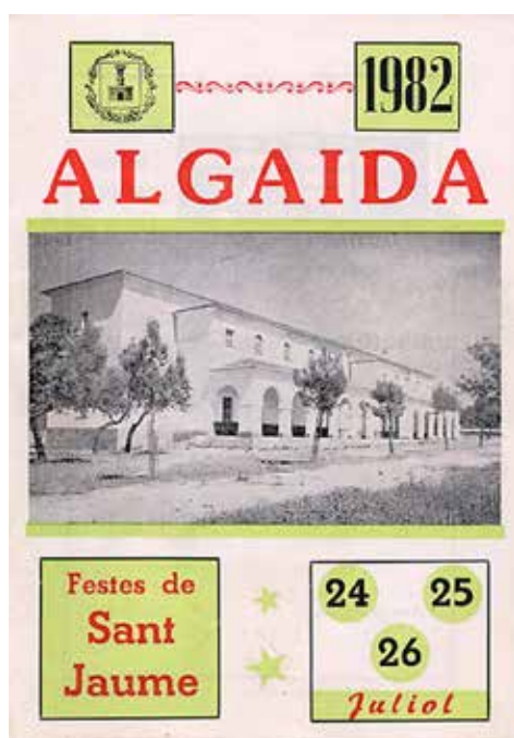
Reproducció del programa de les Festes de Sant Jaume de 1982, que foren organitzades per l'Associació de Pares del Col·legi Pare Bartomeu Pou.