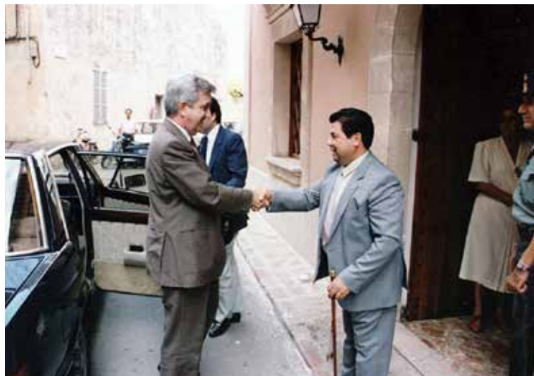
Com a batle d'Algaida, rebent Gabriel Cañellas, president del Govern de les Illes Balears.