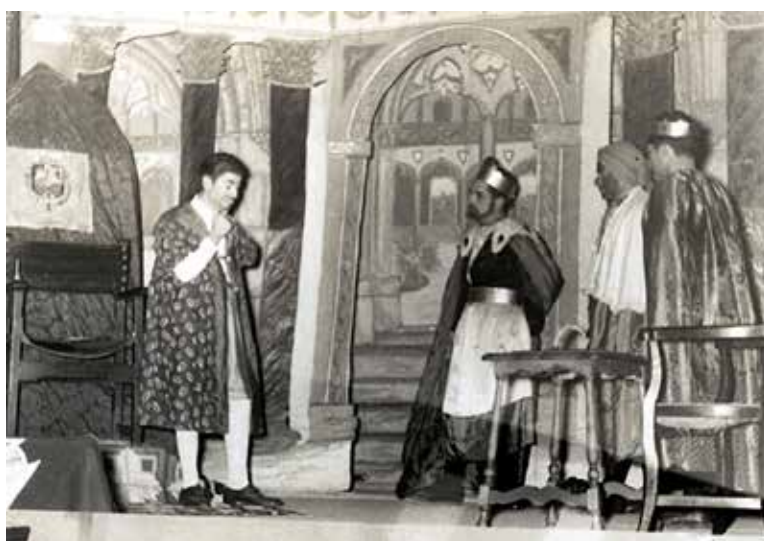
En aquesta pàgina i en les posteriors, 6 fotografies de representacions teatrals. Les quatre primeres, en blanc i negre, al teatre d'Acció Catòlica, i les dues darreres en color, la representació d'Els Reis dins l'església d'Algaida.